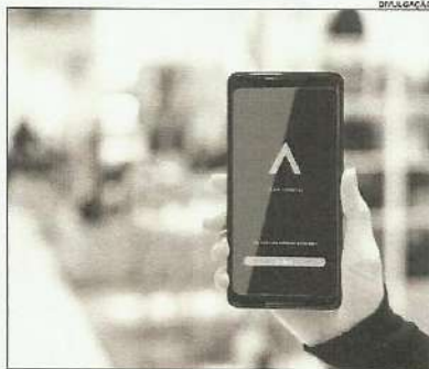
Embora o consumidor lemeno já tenha opções de aplicativos para compras on line voltados para o comércio local, o Napp.Delivery será o único a oferecer ao usuário a possibilidade de adquirir muito mais do que alimentação ou itens de supermercados.

Embora o consumidor lemeno já tenha opções de aplicativos para compras on line voltados para o comércio local, o Napp.Delivery será o único a oferecer ao usuário a possibilidade de adquirir muito mais do que alimentação ou itens de su-